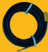
ST 1111 teplotní kabelové čidlo