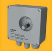
UTR termostat na zed' s vysokým krytím