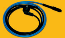
PPC - montážní sada automatický topný kabel s termostatem a vidlicí