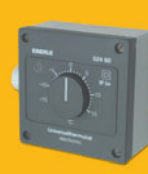
AZT prostorový termostat na zed'