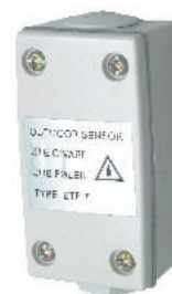
teplotní čidlo ETF-744/99