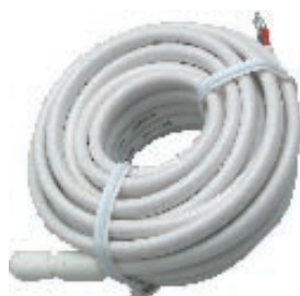
teplotní čidlo ST-1111